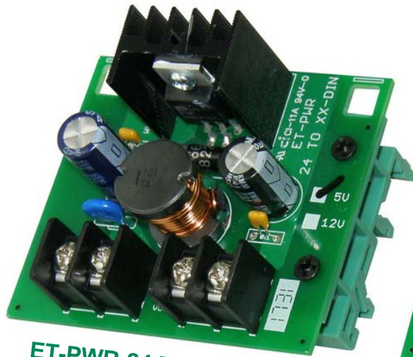
ET-PWR 24 TO 5-DIN