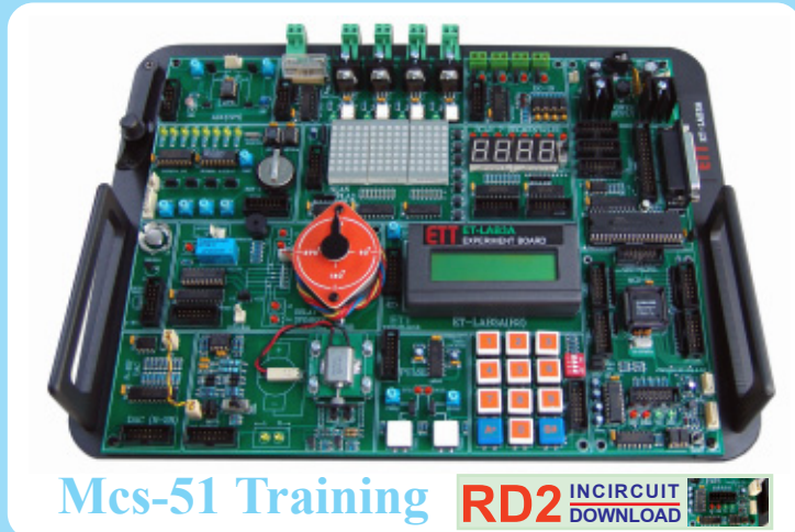
Mcs-51 Training RD2 INCIRCUIT DOWNLOAD