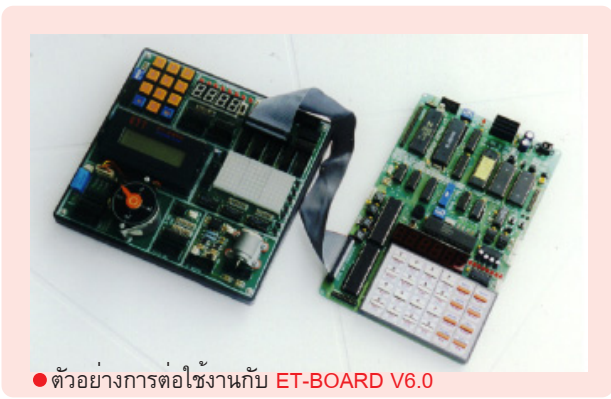
● ตัวอย่างการต่อใช้งานกับ ET-BOARD V6.0

ตัวบอร์ด ... ออกแบบการเชื่อมต่อในการทดลอง I/O ส่วนต่างๆด้วยสายแพรทำให้คุณสามารถต่อทดลอง ได้อย่าง รวดเร็วพร้อมขั้ว CONNECTOR แบบมีขั้ว LOCK ป้องกันคุณ และนักศึกษาผู้ทดลองที่จะต่อผิดได้ นอกจากนี้ชุดทดลอง ET-EXP4 I/O1 Plus นี้ยังบรรจุใน กล่องพลาสติกอย่างดี ปิด เปิด เก็บชุดฝึกได้ ป้องกันการเสียหายจากการเก็บได้เป็นอย่างดี พร้อมโปรแกรมการ ทดลอง ในแผ่นที่คุณ สามารถ LOAD เข้าตัว SINGLE BOARD ใช้ทดลองได้เลยก็ได้ จะคีย์ตามคู่มือการทดลองก็ได้