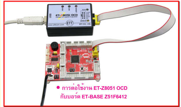
• การต่อใช้งาน ET-Z8051 OCD กับบอร์ด ET-BASE Z51F6412

ET-Z8051 OCD ... เป็นเครื่องมือใช้สำหรับการพัฒนาโปรแกรม MCU ตระกูล Z8051 (MCS51) ของ บริษัท ZILOG ใช้ในการ DEBUG และ IN-SYSTEM PROGRAM (ISP) MCU Z8051 สามารถส่งงานตรวจสอบ ทดสอบ ดูค่าของรีจิสเตอร์ ค่าของข้อมูลในหน่วยความจำ ค่าของตัวแปร ของ MCU ในขณะที่ทำงานจริงได้